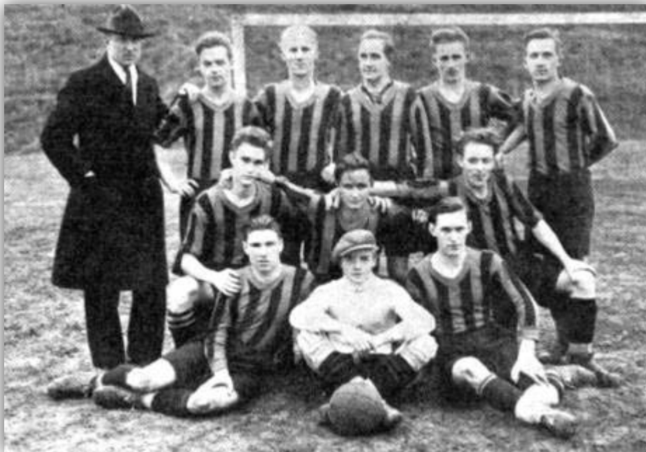
Laget som började frammarschen 1934:

*När det nya serieåret började på hösten 1934 hade flera av lagens spelare bytt klubb och där drog IFK det längsta strået. Inte värre dock än att HIF i derbyt den 30/9 naggade IFK:s planer på serieseger i kanten när de segrade med 4-3. Seriens sista speldag hade IFK chansen att vinna densamma men då måste HIF som inte hade något speciellt att spela för på bortaplan besegra seriens två Åhus. Det gjorde de, om det var bara glädjen att för en dag stå i centrum för intresset bland fotbollspubliken eller det var åhusspelarna som fick stora skälvan i det avgörande ögonblicket. Bollen rullade IFK:s väg på ett ödesbetonat sätt som brukar benämnas att bollen är rund.